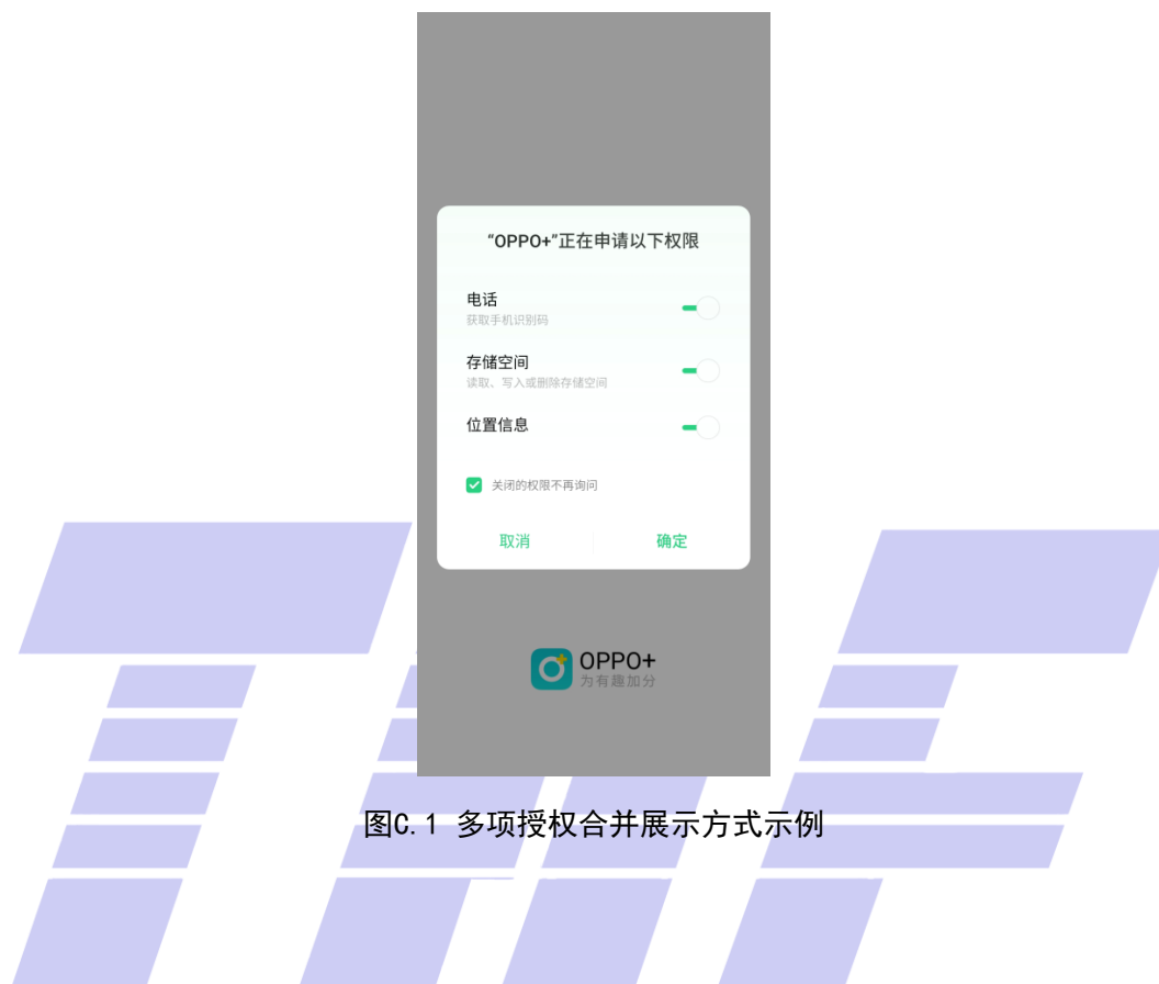
图C.1 多项授权合并展示方式示例