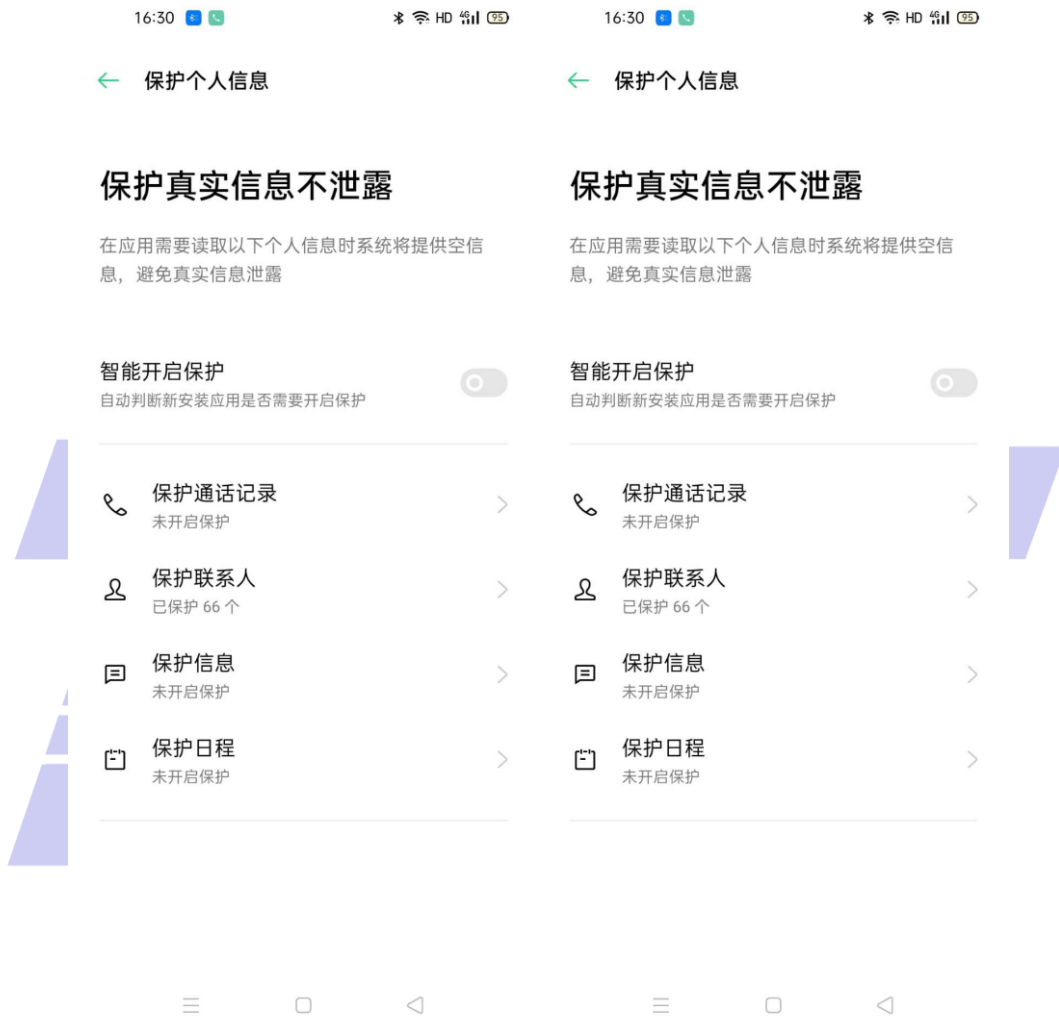
图D.1 多项授权合并展示方式示例